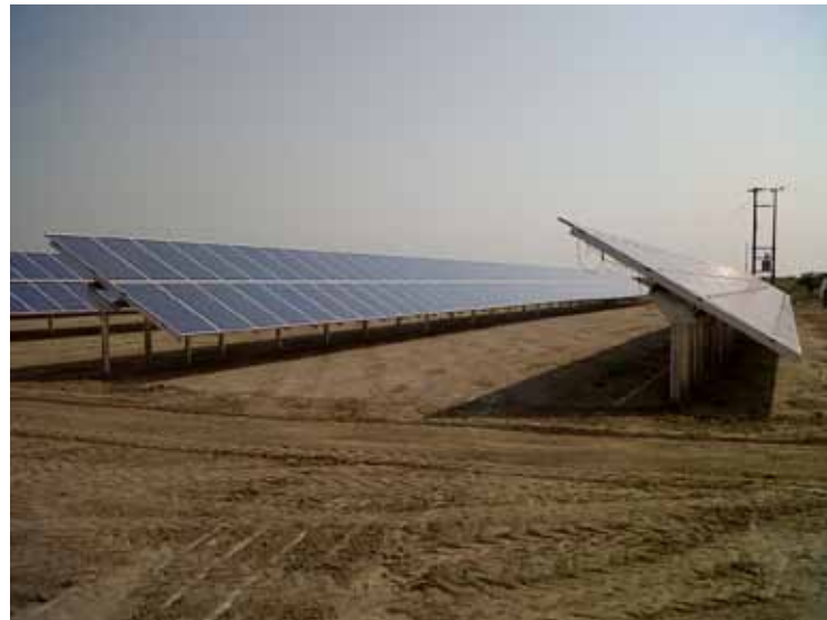
Έργο της ADVARTIA 100kWp στη Μελίκη, Βεροίας.