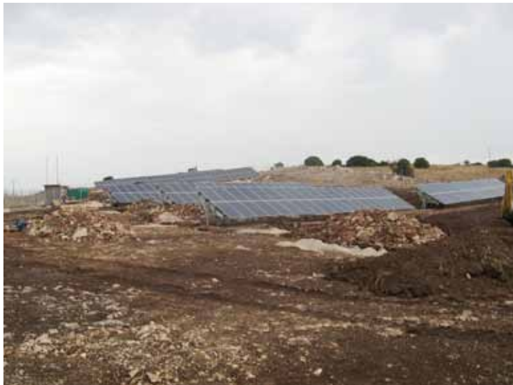
Έργο της ADVARTIA 5x20kWp στα Ιωάννινα.